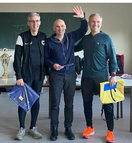
Gold und Bronze in der M55