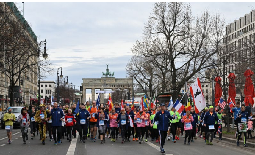
Traditioneller Jahresbeginn mit dem Neujahrslauf am Brandenburger Tor

Zwischen der Führungsgruppe und dem Verfolgerfeld entstand im Laufe des Rennens ein Gap, woraufhin einige Teilnehmende falsch abbogen (so kommen auch die unterschiedlichen Streckenlängen bei den Sieger:innen zustande). Damit das im nächsten Jahr nicht wieder geschieht, werden die Strecken 2023 in Absprache mit dem zuständigen Förster noch besser abgesichert.