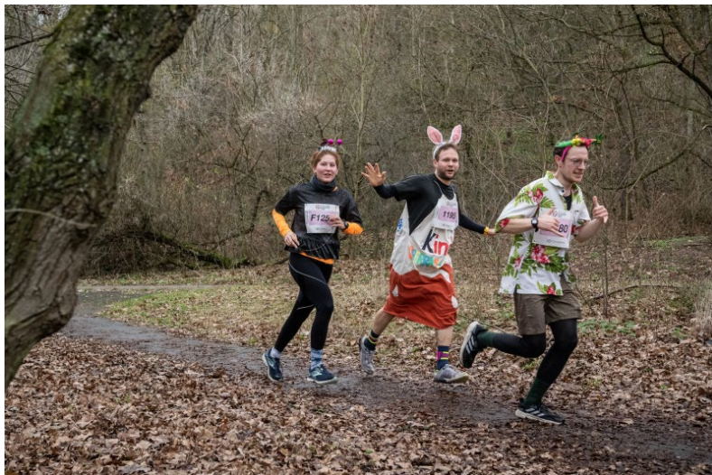
Traditioneller Jahresausklang beim Berliner Silvesterlauf 2022

Zu diesem Jahreswechsel gab es wieder den traditionellen Silvesterlauf und den traditionellen Neujahrslauf. Ganz gleich ob Läufer:innen aus Berlin oder sportlicher Tourist, der Berliner Silvesterlauf gilt mittlerweile als Kult-Termin in den Laufsport-Kalendern. Schließlich gibt es nichts Schöneres, als den letzten Tag im Jahr sportlich in unserem heimischen Trainingsgebiet zu begehen. Die Läufer:innen starteten wie in jedem Jahr am Mommsenstadion. Allerdings starteten sie noch nie bei so hohen Temperaturen. Seit der ersten Austragung des Events vor viereinhalb Jahrzehnten, war es nie so warm wie dieses Mal, das Thermometer zeigte zum ersten Wettbewerb um 12.00 Uhr 15 Grad an. Obwohl der Himmel wolkenverhangen war, blieb es bei einigen Böen nahezu trocken. Der Stimmung tat das keinen Abbruch, die oftmals kostümierten Sportler:innen nahmen mit Freude die diversen Strecken unter ihre Füße. Dass die Teilnehmenden sich bei dieser SCC EVENTS Veranstaltung verkleiden, gehört wie der obligatorische Pfannkuchen im Ziel, einfach dazu. Als Verkleidungen gab es von Pilzen, Einhörnern, Weihnachtsbäumen, Dinos und Clowns bis zu Prinzessinnen viel zu entdecken. Die schönsten Kostüme wurden prämiert. Am besten kamen Jana Soethout vom Berliner Track Club und Janne Büttel mit dem Parcours über die 9,2 bzw. 10,2 Kilometer zurecht. In 33:52 respektive 33:47 Minuten gewannen sie das Rennen.